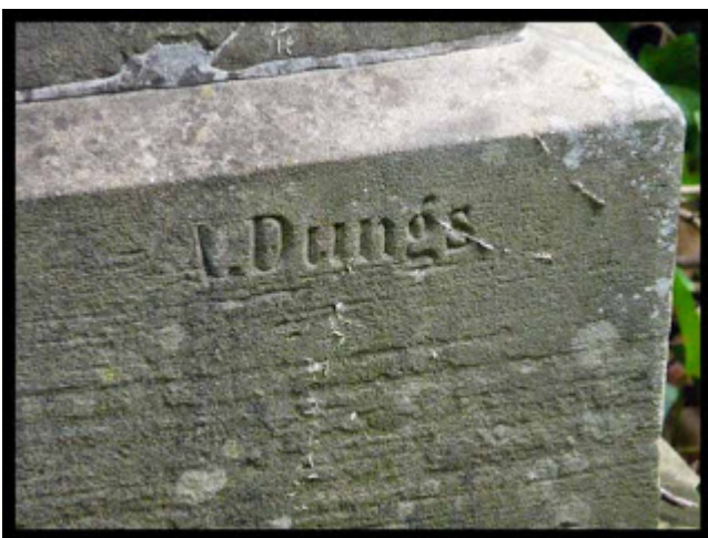
Inschrift des Steinmetz'.

Auf dem obigen Bild sieht man noch zwei Eisenstangen aus dem