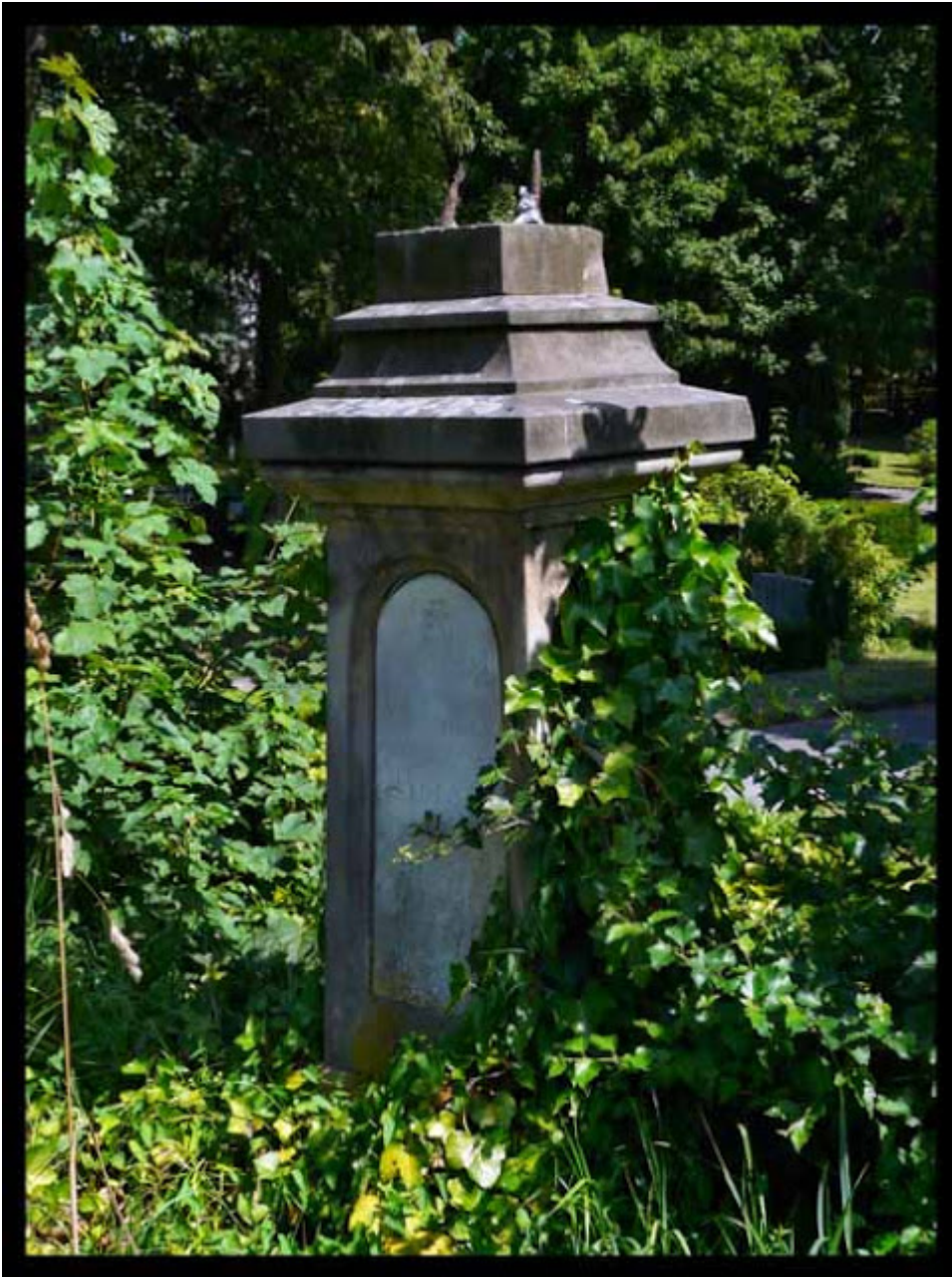
Erneut das Denkmal auf dem reformierten Friedhof.