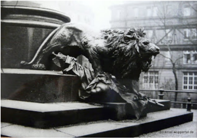
Fotografie des Löwen, (Bild ergänzt am 13.01.2012)

Das Denkmal zeigt eine Reiterstatue des Kaisers als Feldherr auf einem Granitpostament. An diesem lehnt sitzend die Germania und hält Symbole des Krieges und des Friedens in den Händen: Schwert und Eiche, Lorbeer und Palme. Auf der Rückseite des Denkmals schritt ein bronzener Löwe die Stufen hinab, unter den Pranken Trophäen des Sieges. An den beiden Seitenflächen zeigten Bronzereliefs den Auszug und die Heimkehr der Elberfelder Krieger.