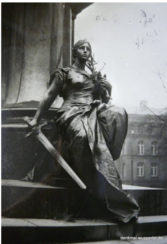
Fotografie der Germania, (Bild ergänzt am 13.01.2012)