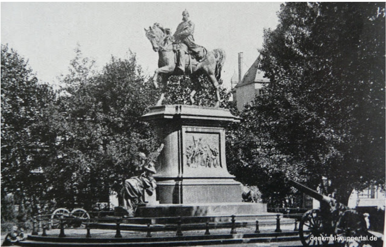
Fotografie des Kaiser-Wilhelm-Denkmal. Bild entnommen aus:

Das Denkmal zeigt eine Reiterstatue des Kaisers als Feldherr auf einem Granitpostament. An diesem lehnt sitzend die Germania und hält Symbole des Krieges und des Friedens in den Händen: Schwert und Eiche, Lorbeer und Palme. Auf der Rückseite des Denkmals schritt ein bronzener Löwe die Stufen hinab, unter den Pranken Trophäen des Sieges. An den beiden Seitenflächen zeigten Bronzereliefs den Auszug und die Heimkehr der Elberfelder Krieger.