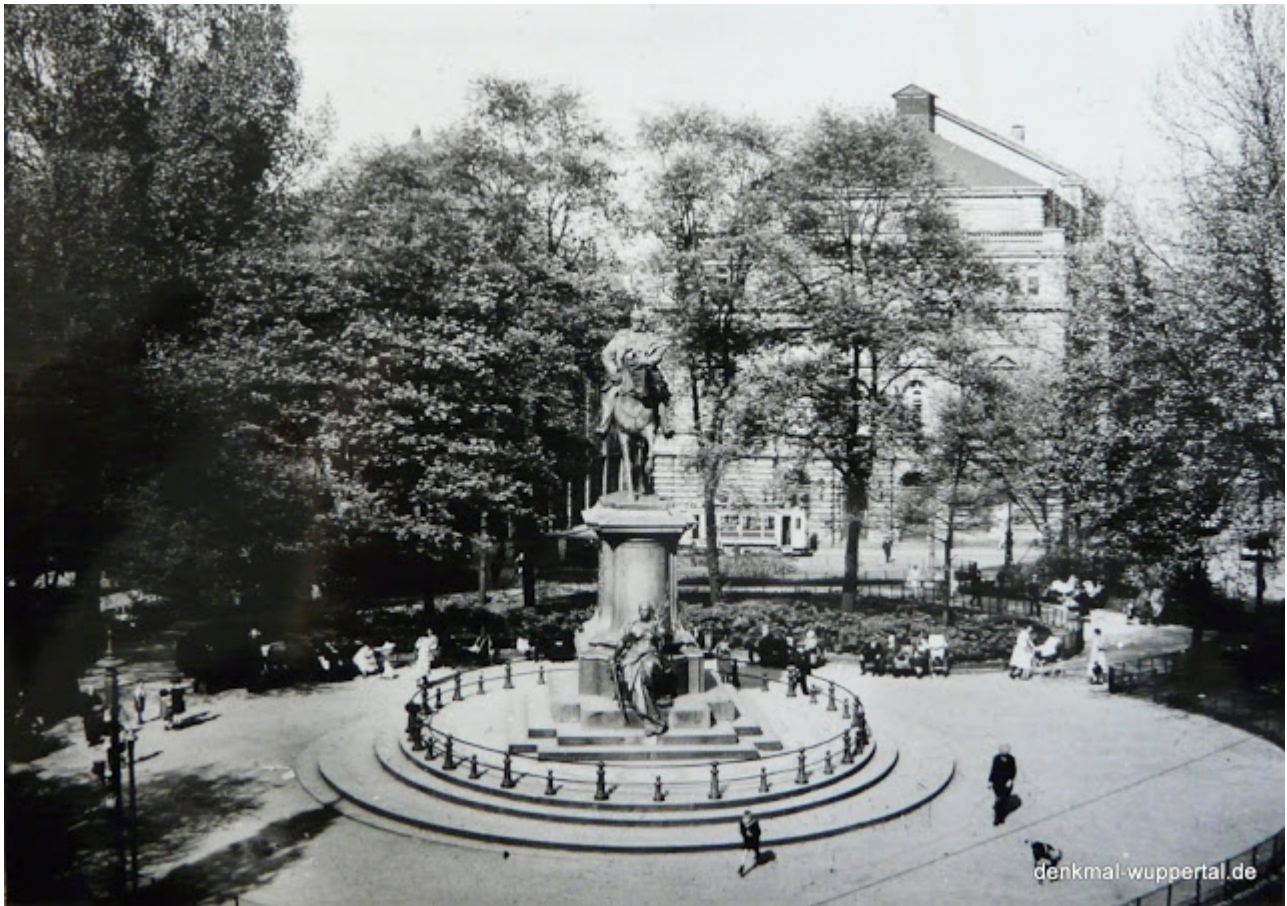
Fotografie des Kaiser-Wilhelm-Denkmal. (Bild ergänzt am 13.01.2012)