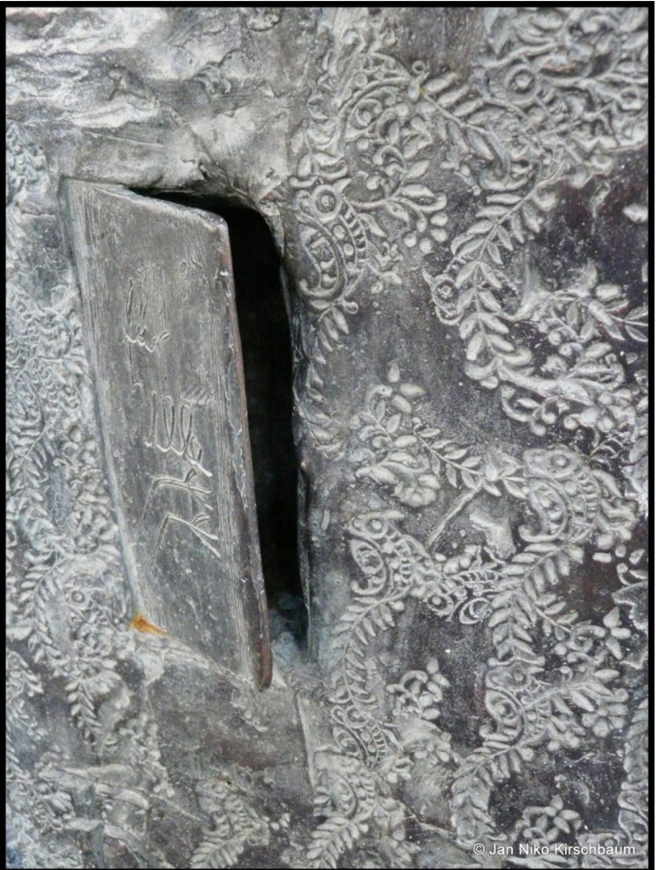
Der Gruß an Ulle Hees.